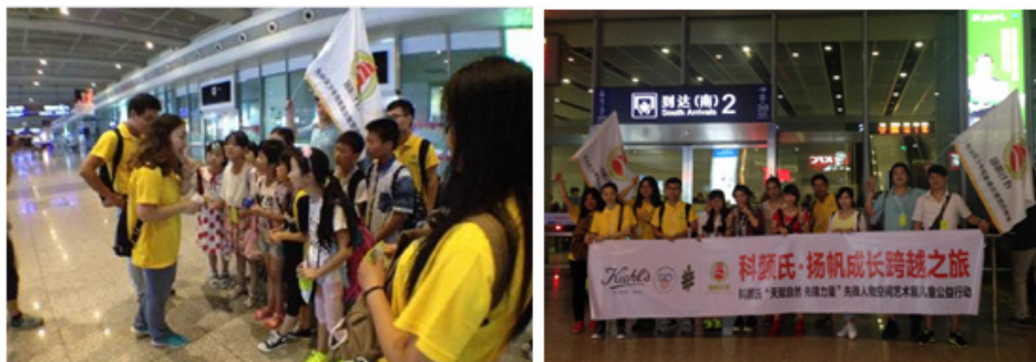
江西的小朋友到达车站

活动详情： http://yangfanbook.sina.com.cn/news/1317