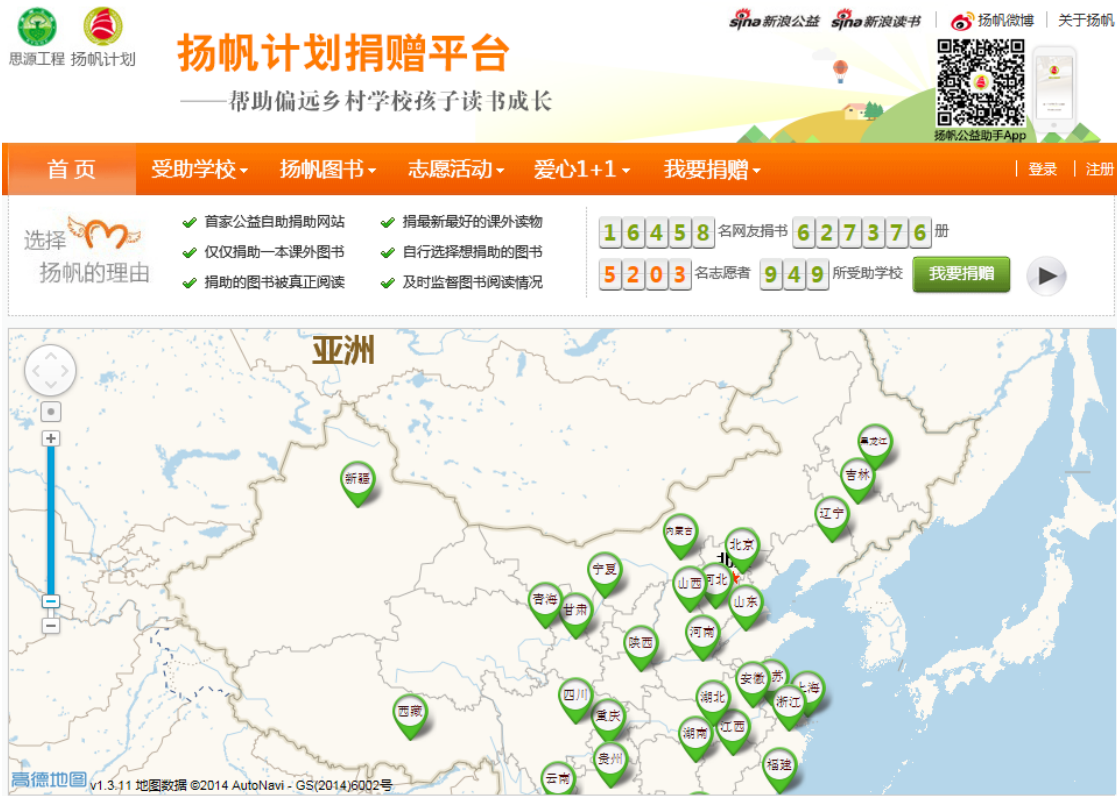
扬帆计划网站捐赠平台: http://yangfanbook.sina.com.cn/

扬帆计划捐助平台自 2009 年 5 月正式上线运行至今，线上平台学校共计 933 所，得到了近 17000 名网友、若干爱心企业以及其他公益组织的捐助。随着捐助持续，很多学校获捐的物资也日渐饱和，为了让更多的孩子受益、捐赠物资被更需要的学校利用，项目组也根据实际回访调查学校情况暂停部分学校，截止目前已有 388 所停捐，剩余线上捐赠学校 545 所。