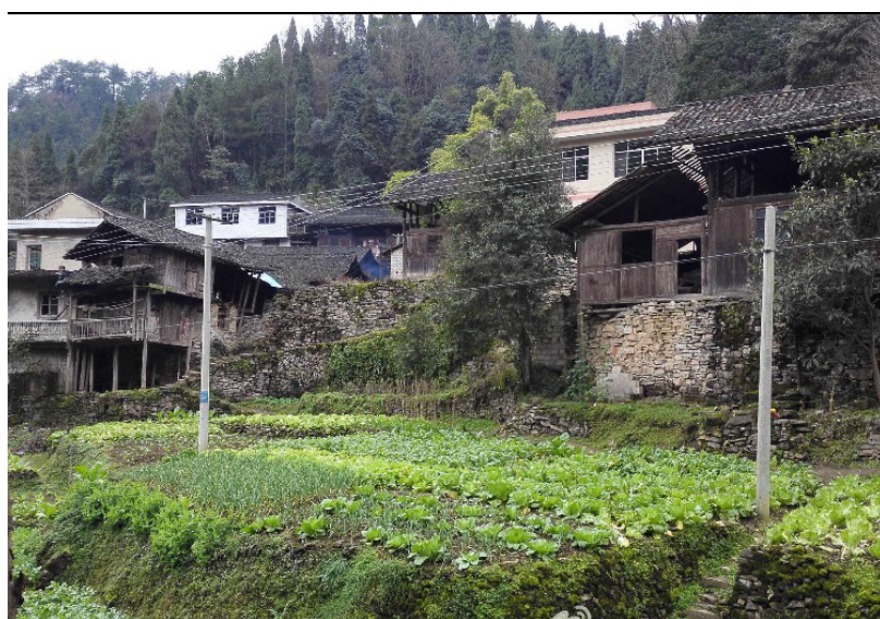
湖南省怀化市新晃侗族自治县大湾罗乡冷水冲村