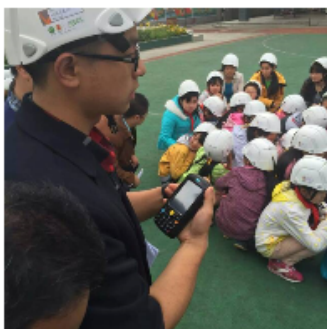
手持无线搜寻终端 卫星数据指挥平台

给每一位师生配发一顶应用“最新物联网技术”具备高科技含量的“电子可识别防灾头盔”。使用高科技防灾头盔配合“手持无线搜寻终端”可以直接搜寻到学生所在的位置，给搜救提供便捷的手段。数据同时报送到搜救队，可根据数据集市了解各学校的灾情，及时调度。此外，救援队、医疗救护队也可以依据“无线搜寻终端”提供的受困人员详细个人信息资料（姓名、血型、紧急联系人电话等），提前准备血浆与救援方案，为救护争取最宝贵的时间。